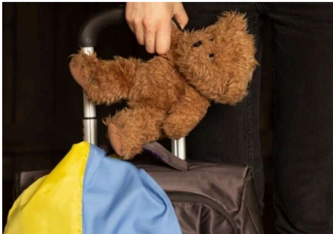
В Україну повернули ще двох дітей, які майже все життя провели в окупації

На територію, підконтрольну Україні, в рамках ініціативи Bring Kids Back UA вдалося повернути брата та сестру, які майже все своє життя прожили в окупації.