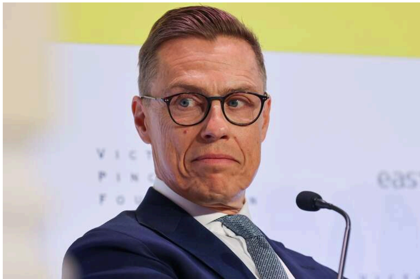
Президент Фінляндії дав прогноз, коли в Україні розпочнеться перемир'я

Президент Фінляндії Олександр Стубб вважає, що перемир'я між Україною та Росією може бути досягнуто в найближчі місяці. Таку думку він висловив у четвер, 30 січня, під час зустрічі з журналістами, повідомляє фінське видання YLE .