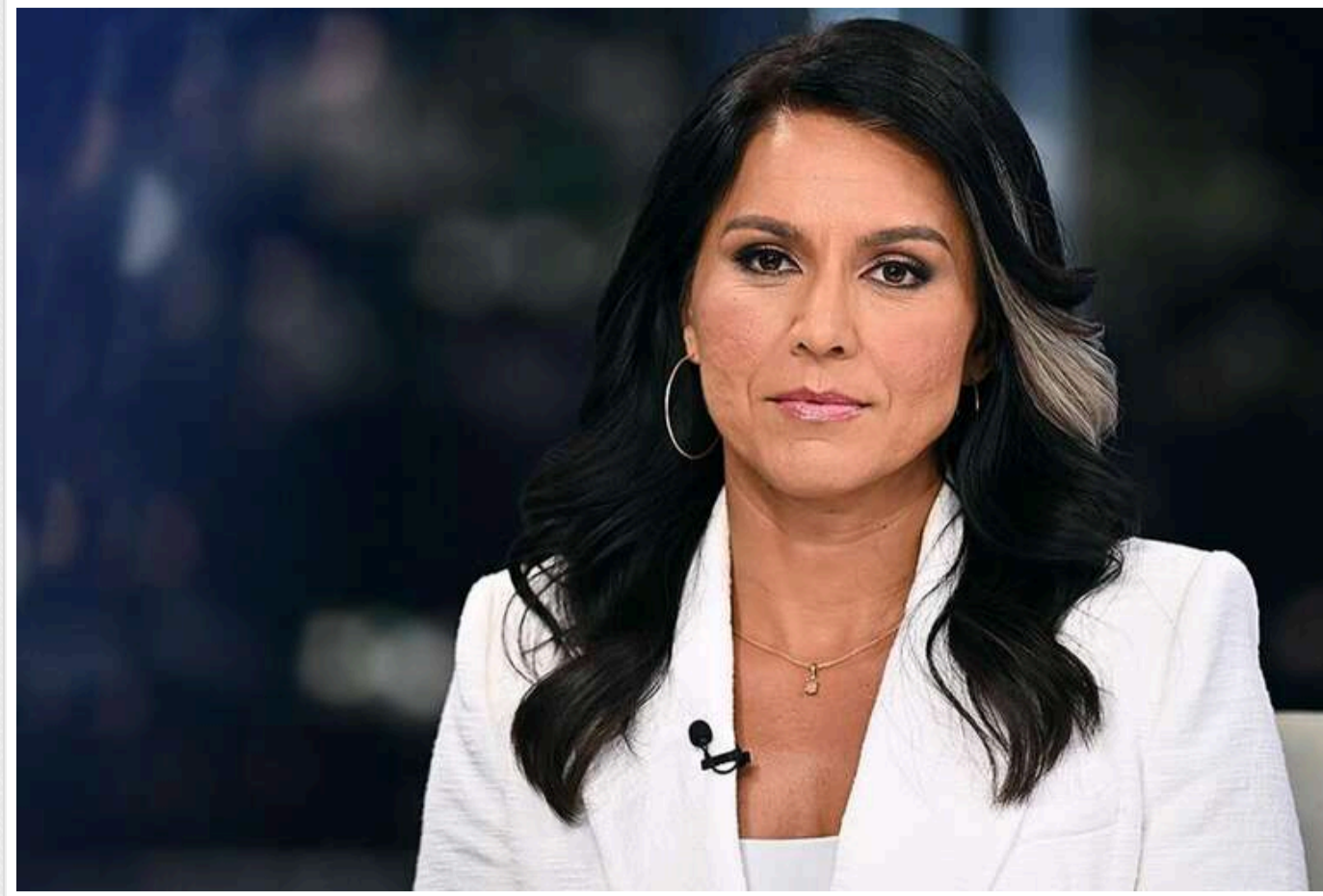
Москва відповідальна за війну в Україні, - Тулсі Габбард

Росія залишається стратегічним конкурентом для США, і саме Москва несе відповідальність за війну в Україні.