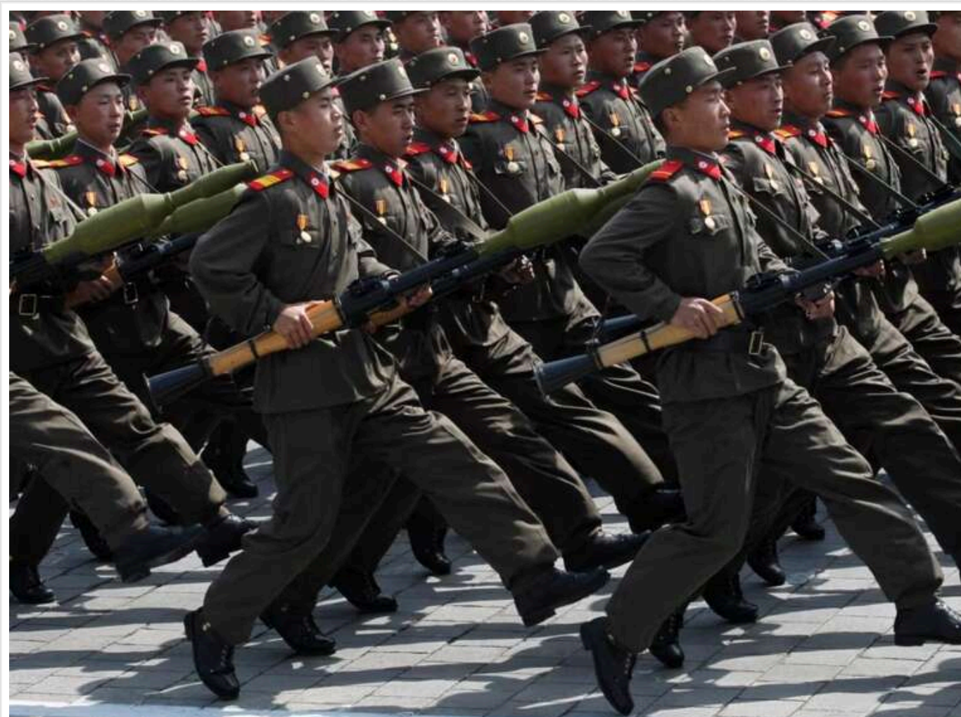
NYT: Військових КНДР відвели з лінії фронту в Курській області після серйозних втрат

Північнокорейські солдати, які приєдналися до своїх російських союзників у війні проти українських Сил оборони, були відведені з лінії фронту в Курській області після значних втрат.