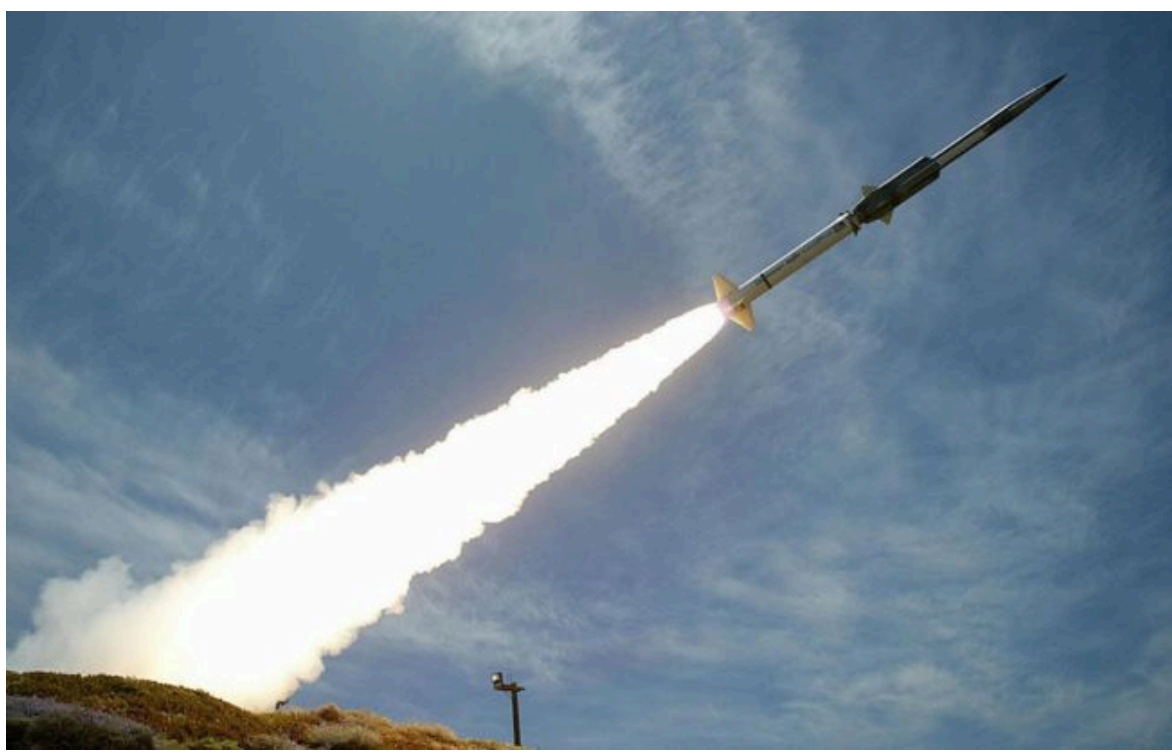
Фото: через нестачу ракет до ППО російські "Циркони" стали новим викликом для України