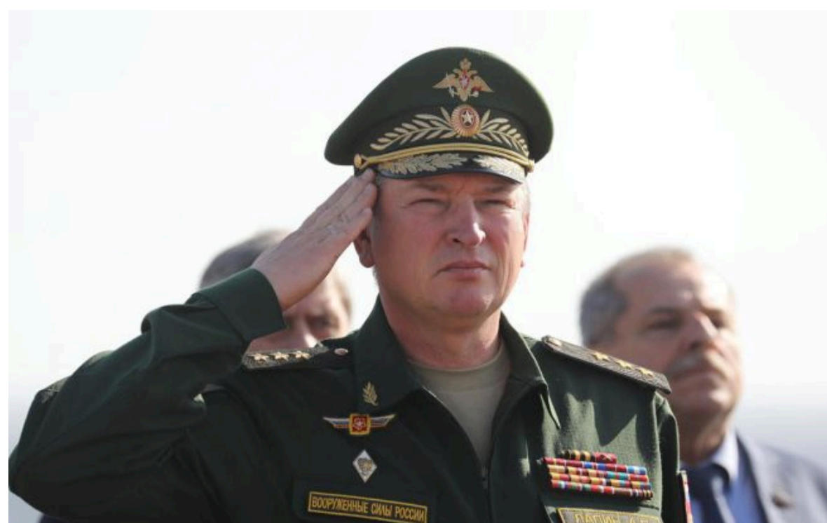
Фото: генерал армії РФ Олександр Лапін (росЗМІ)

Розумій ситуацію на фронті через факти, а не чутки з РБК-Україна у Google