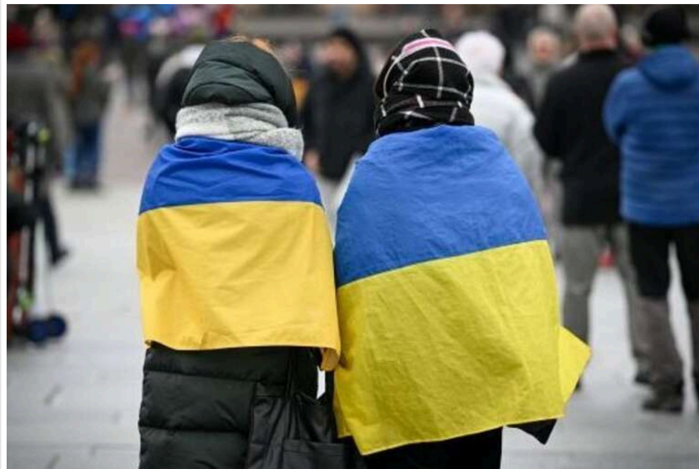
Польща, Чехія і Німеччина готують центри для підтримки українських біженців, які бажають повернутися додому

Влади Польщі, Чехії та Німеччини розглядають можливість створення центрів, які допоможуть українським біженцям, що бажають повернутися на Батьківщину. Ці центри забезпечуватимуть підтримку в юридичних, транспортних і побутових питаннях, а також стануть місцями для спілкування та інтеграції.