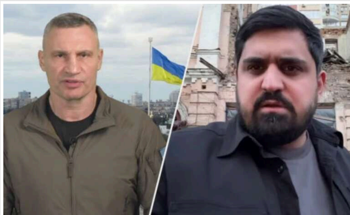
Конфлікт Кличка та Ткаченка загострюється: почалися звинувачення в «тіньових схемах» з бюджетом

Протистояння між мером Києва Віталієм Кличком та новим головою Київської міської військової адміністрації Олександром Ткаченком набирає оберті.