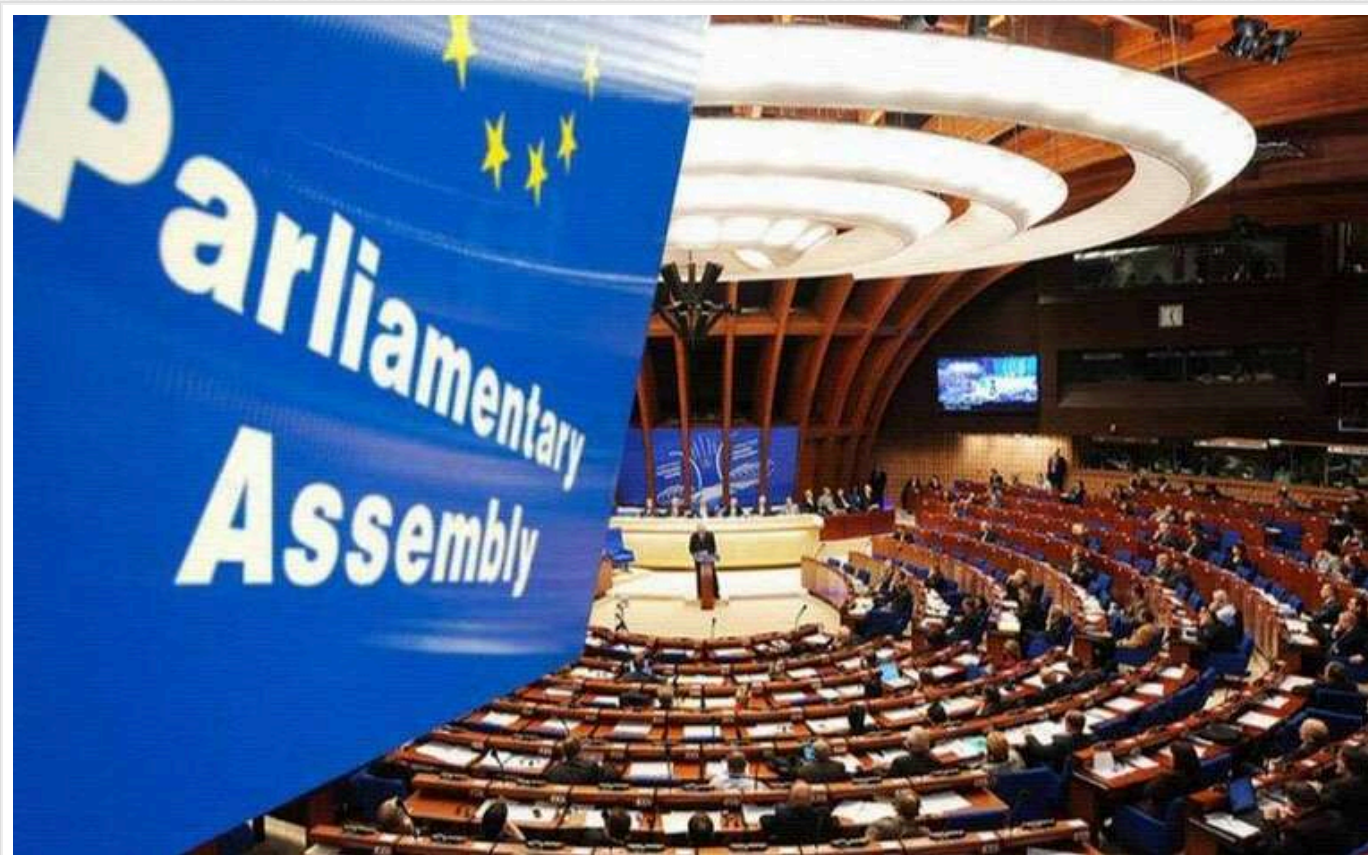
Парламентська асамблея Ради Європи підтвердила принцип "нічого про Україну без участі України"