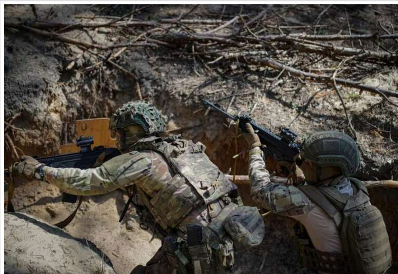
В ОТУ "Хортиця" поділилися інформацією про події в районі Покровська

Російські війська продовжують активно наступати на Покровському напрямку і намагаються оточити місто з південного заходу.