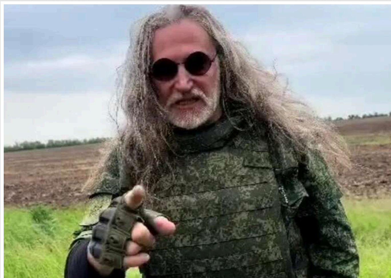
Мінкульт вніс Джигурду в список осіб, які становлять загрозу нацбезпеці України

Міністерство культури й стратегічних комунікацій України внесло російського актора Микиту Джигурду до переліку осіб, які становлять загрозу національній безпеці України. Це рішення було ухвалене через його активну участь в антиукраїнських заходах, спрямованих на виправдання та легітимізацію збройної агресії РФ проти України.