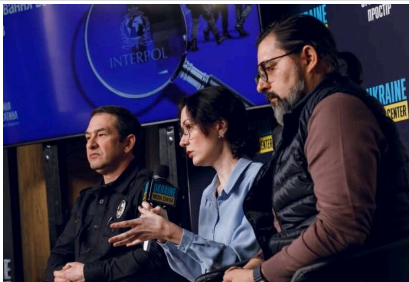
Інтерпол відмовляється оголошувати в розшук російських воєнних злочинців: 70 запитів від України — 0 відповідей

З початку повномасштабної війни Нацбюро Інтерполу України отримало понад 70 запитів слідчих на розміщення оповіщень про міжнародний розшук російських воєнних злочинців.