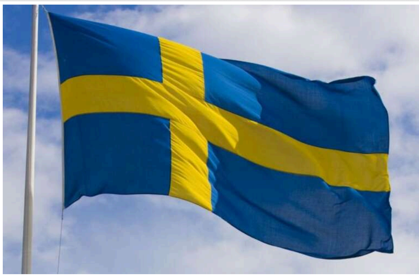
Швеція оголосила про наймасштабніший пакет військової допомоги для України

Швеція передасть Україні найбільший пакет військової допомоги. Його вартість складає 13,5 млрд шведських крон (близько 1,25 млрд доларів).