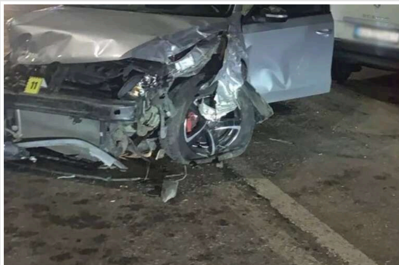
П'яний водій у Києві на швидкості зніс сім авто: двоє пасажирів у лікарні

У столиці водій Volkswagen Passat у стані алкогольного сп'яніння спровокував велику ДТП, врізавшись у сім припаркованих авто, про це інформує Київська поліція.