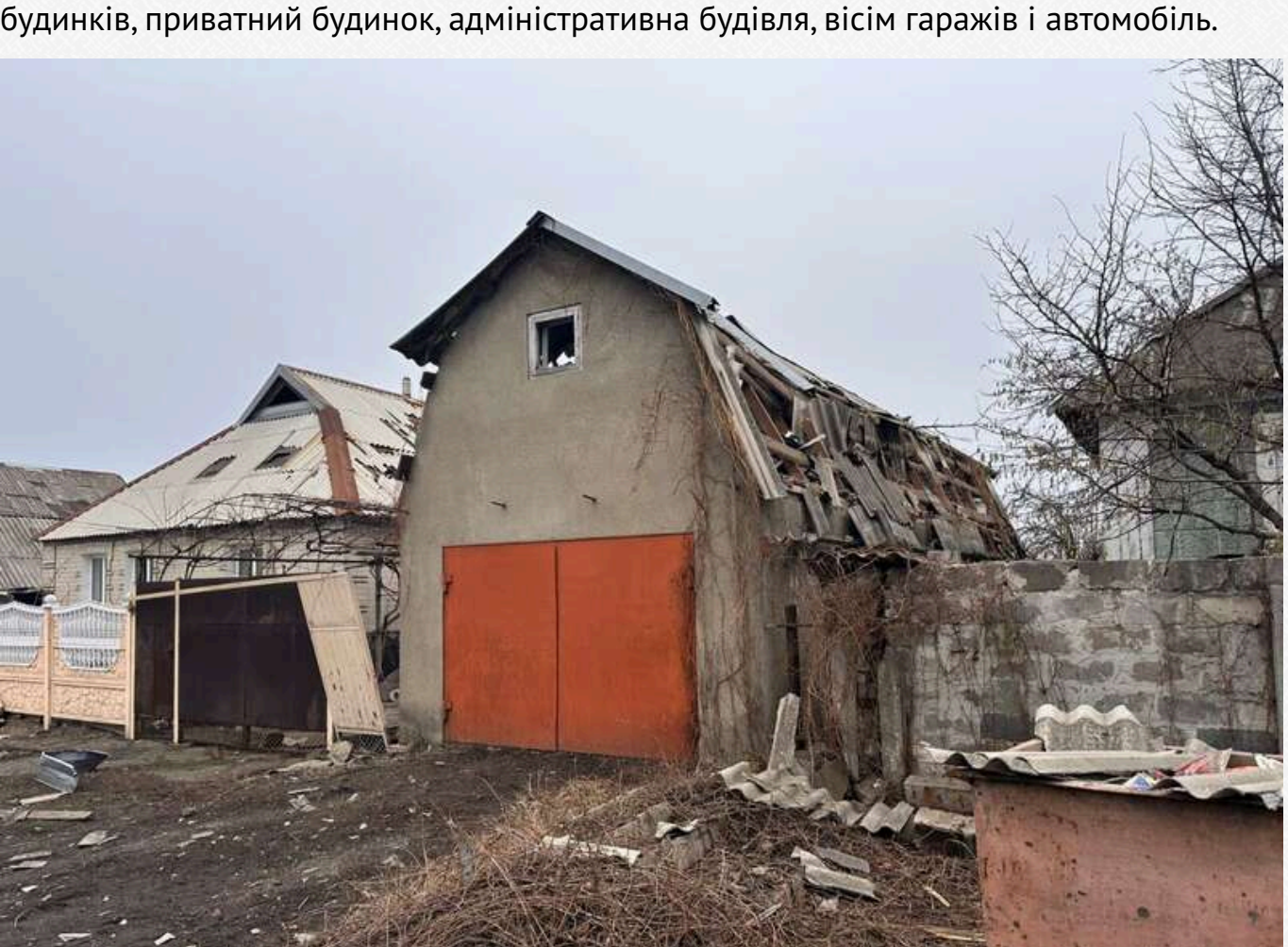
У Бахмутському районі, зокрема в Сівєрську, через обстріли загинула одна людина, пошкоджено п'ять житлових будинків.