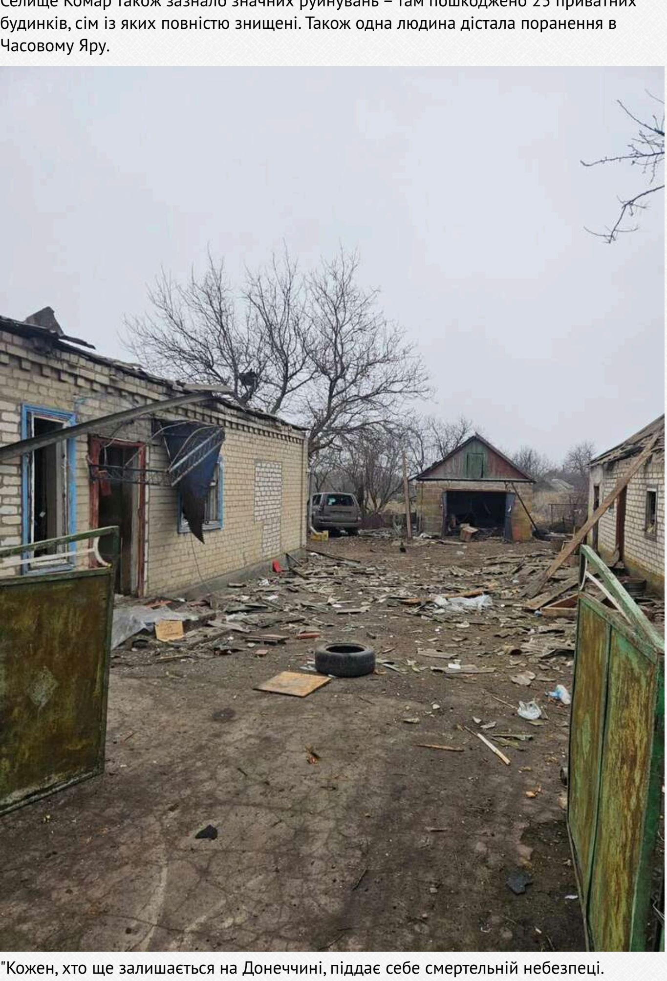
"Кожен, хто ще залишається на Донеччині, піддає себе смертельній небезпеці. Бережіть себе! Евакуюйтесь!", – звернувся до жителів регіону Філашкін.