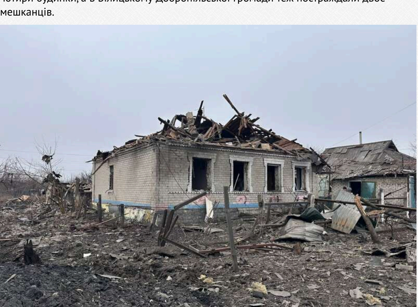
У Лимані пошкоджено сім приватних будинків і п'ять господарчих будівель, в Ілїнінці знищено три об'єкти. У Костянтинівці постраждали 12 багатоквартирних будинків, приватний будинок, адміністративна будівля, вісім гаражів і автомобіль.