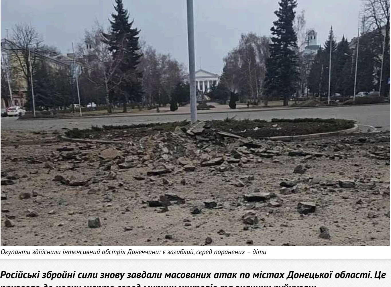
Окупанти здійснили інтенсивний обстріл Донецчини: є загибелі, серед поранених – діти

Російські збройні сили знову завдали масованих атак по містах Донецької області. Це призвело до нових жертв серед мирних жителів та значних руйнувань.