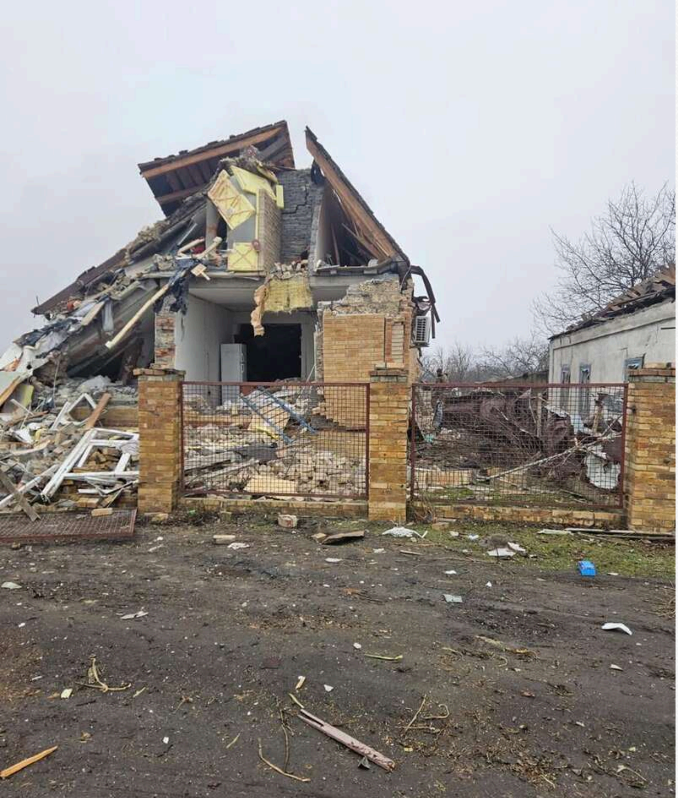
Селище Комар також зазнало значних руйнувань – там пошкоджено 25 приватних будинків, сім із яких повністю знищені. Також одна людина дістала поранення в Часовому Ярї.

У Костянтинівці пошкоджено три приватні будинки, в Іванопілі загинула одна людина, знищено сім будинків. У Білокузьминівці пошкоджено шість житлових будинків внаслідок обстрілів.