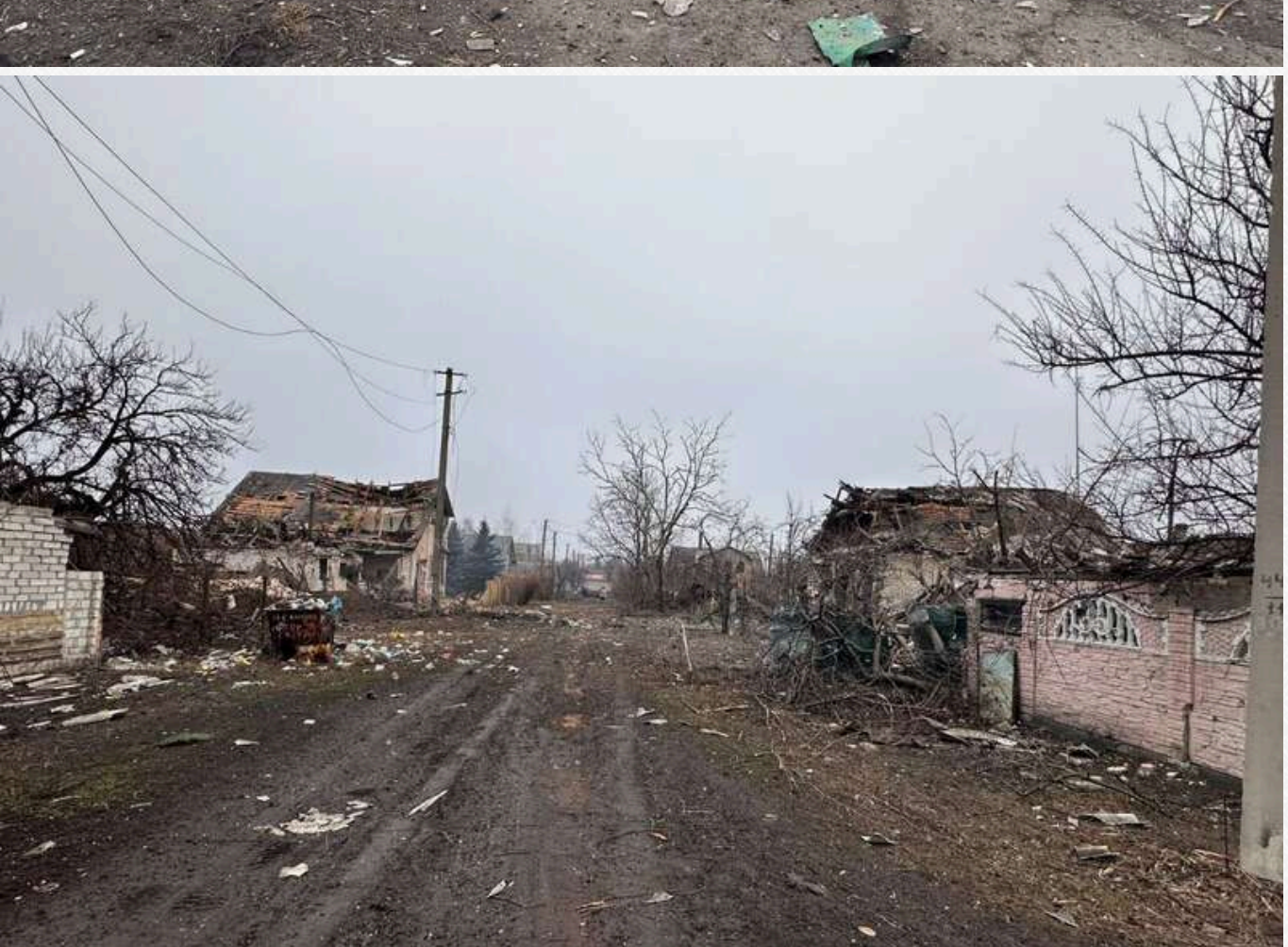
Протягом минулої доби окупанти здійснили 16 атак по населених пунктах регіону. З прифронтових територій евакуювали 232 людини, серед яких п'ятеро дітей.