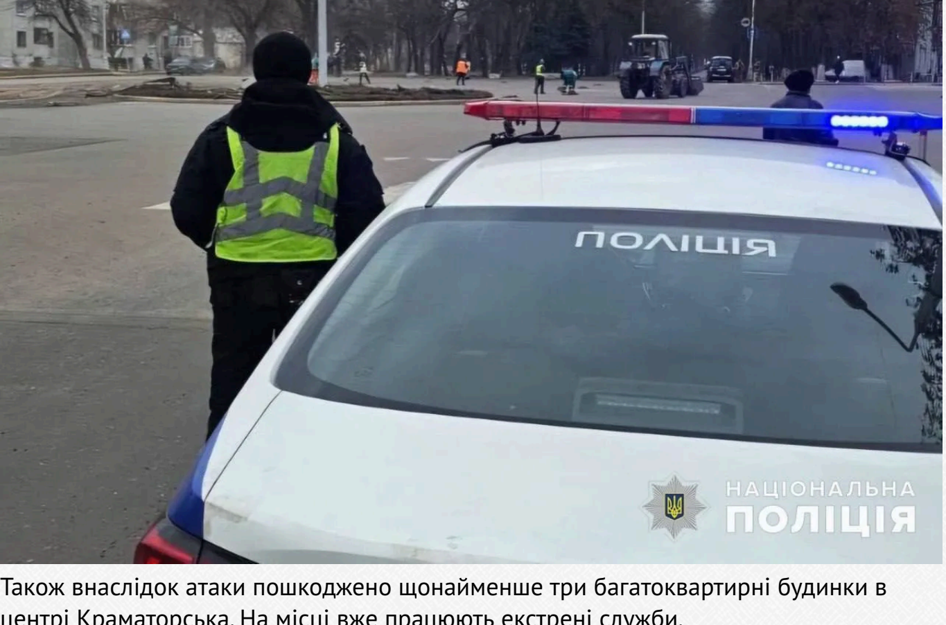
Також внаслідок атаки пошкоджено щонайменше три багатоквартирні будинки в центрі Краматорська. На місці вже працюють екстрені служби.

У МВС зазначили, що російські окупанти завдали удару по місту, попереду, з РСЗВ "Торнадо-С".