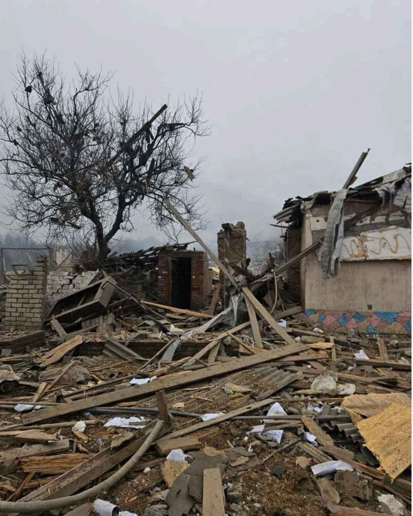
Вранці 30 січня Філашкін закликав, що у Покровську внаслідок обстрілів пошкоджено двох людей, сімнадцять жителів та кав'ярню. У Родинському пошкоджено чотири будинки, а в Білицькому Добропільської громади теж постраждали двоє мешканців.