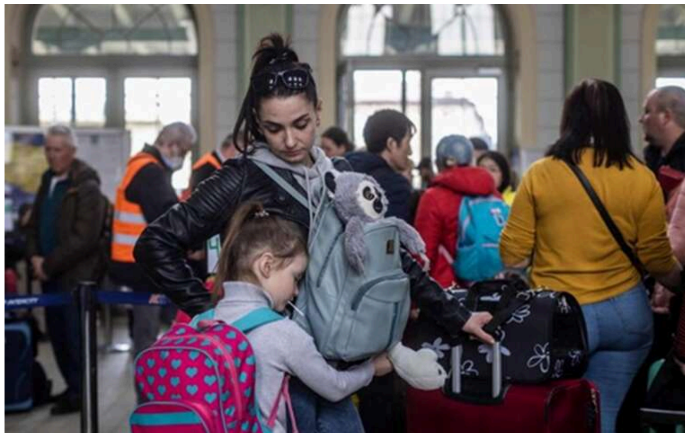
На тлі новин про скасування виплати "800+" українки у Польщі бояться за виживання

Українки в Польщі приголомшені скасуванням виплат «800+». Вони бояться за своє виживання, – Wprost.