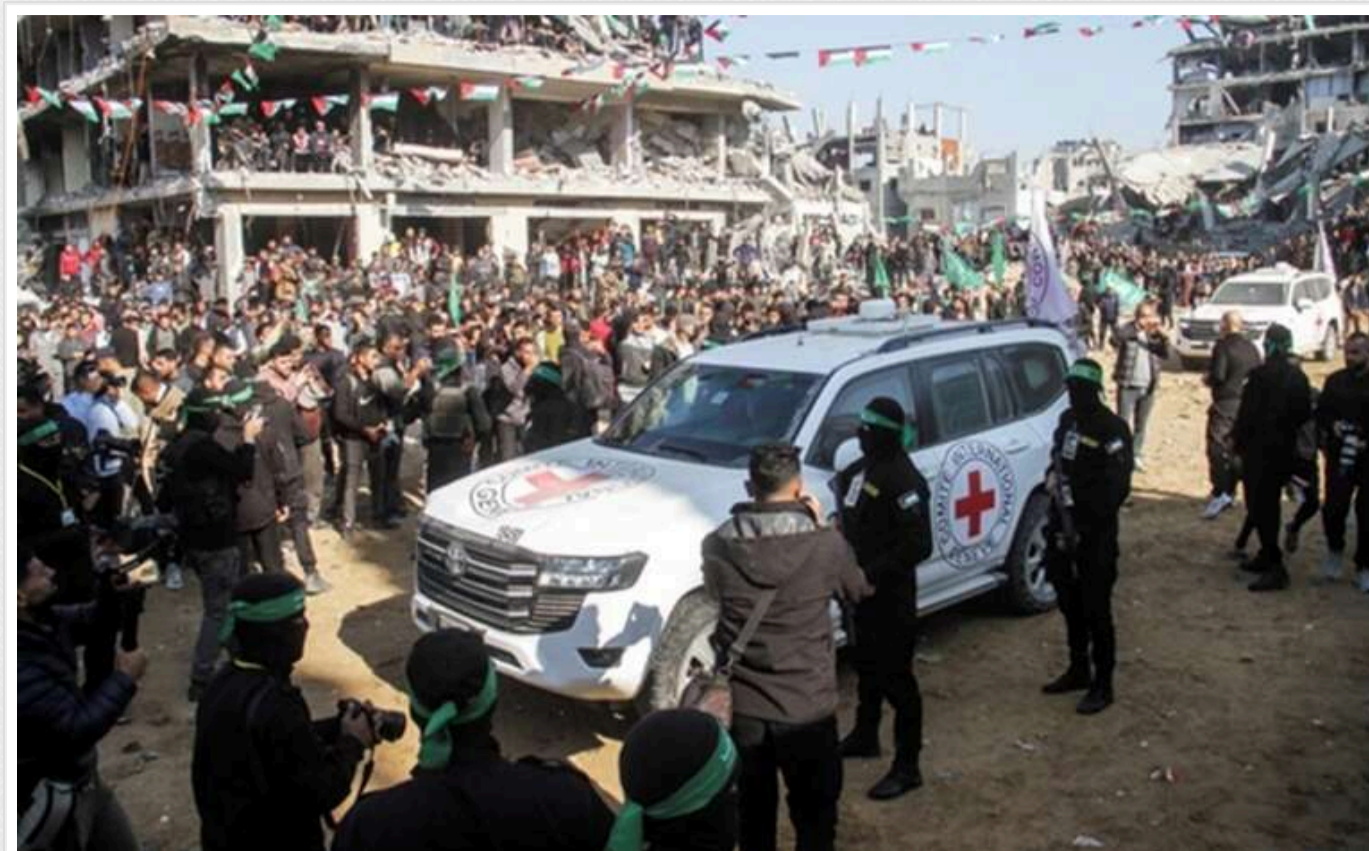
ХАМАС передає Ізраїлю ще трьох заручників

Згідно з угодою про перемир'я, бойовики мають звільнити у четвер трьох ізраїльських заручників і п'ятьох громадян Таїланду, захоплених у полон.