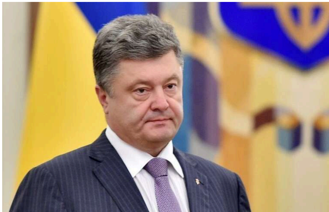
Геращенко: Порошенко хочуть відсторонити від пленарних засідань ВР

Петра Порошенко можуть відсторонити від участі в пленарних засіданнях Ради на пів року.