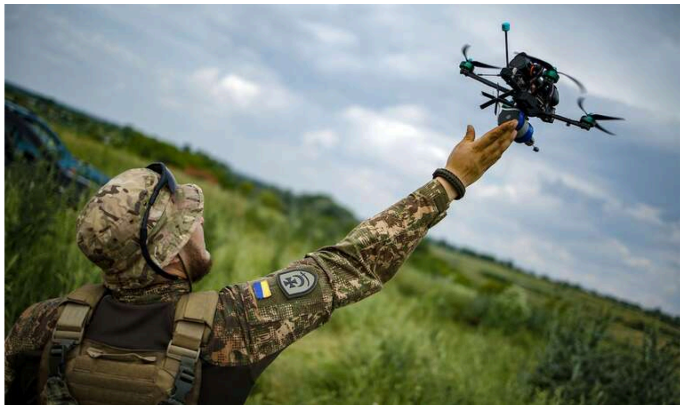
БЛА Made in Ukraine: Міноборони розпочало ліцензоване виробництво FPV-дронів

Міністерство оборони почало ліцензоване виробництво сучасних FPV-дронів на базі одного з державних підприємств.