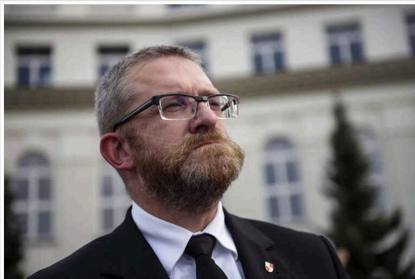
Ультраправий польський депутат Гжегож Браун зірвав хвилину мовчання в пам'ять про жертв Голокосту в Європарламенті

Під час спеціальної зустрічі Європарламенту з нагоди Міжнародного дня пам'яті жертв Голокосту в Брюсселі 29 січня ультраправий польський євродепутат Гжегож Браун почав вигукувати: "Молімося за жертв єврейського геноциду в Газі".