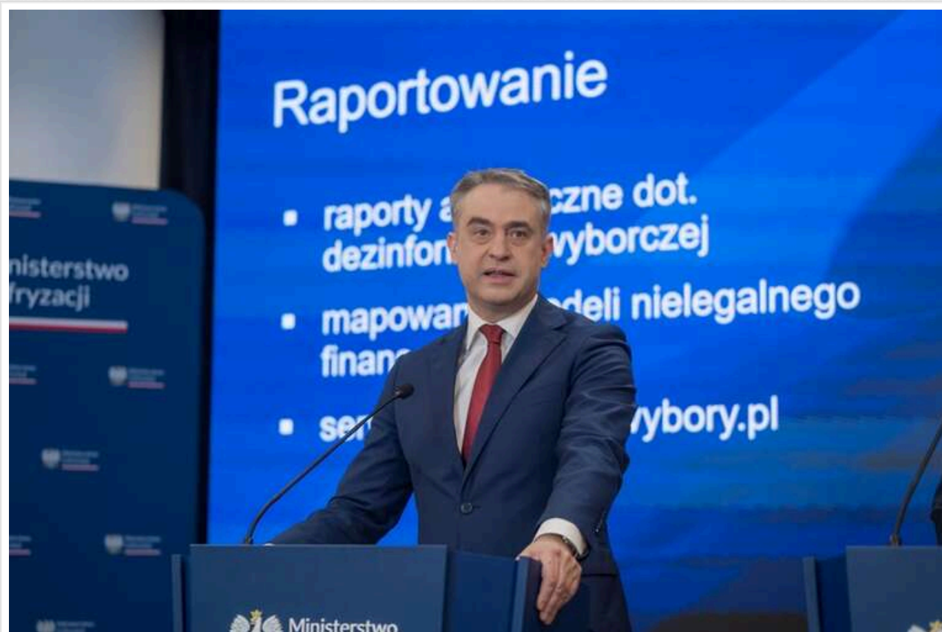
РФ хоче вербувати поляків, аби вплинути на президентські вибори

Високопоставлений представник польського уряду звинуватив Росію в спробі завербувати громадян Польщі через dark net з метою впливу на президентську виборчу кампанію в Польщі, повідомило 28 січня агентство Reuters.