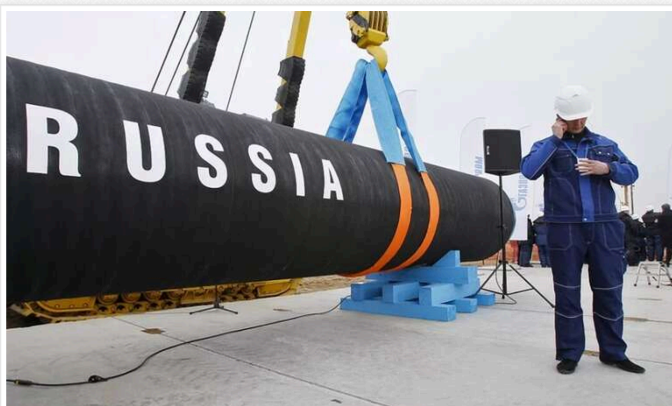
FT: ЄС обговорює повернення до закупівель російського газу в рамках можливого мирного врегулювання в Україні

В ЄС розглядають можливість відновлення закупівель російського трубопровідного газу в контексті можливого мирного вирішення війни в Україні, повідомляє Financial Times з посиланням на джерела.