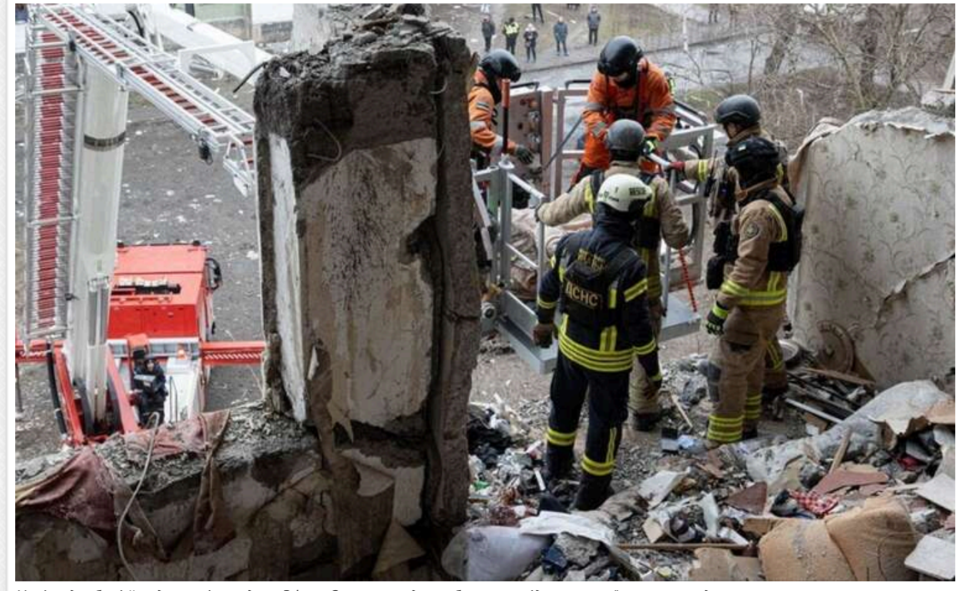
Нові подробиці й кадри з місця удару РФ по Сумах: серед загиблих внаслідок ворожої атаки – подружжя

У ніч проти 30 січня російська терористична армія завдала удару дроном-камікадзе по багатопверховому будинку в Сумах. Рятувальники дістали з-під завалів тіла пари.