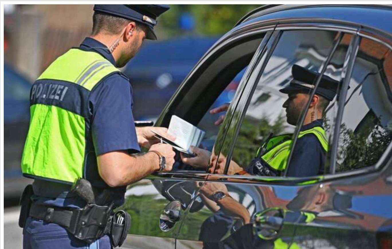
Німеччина вирішила повернути постійний прикордонний контроль із країнами ЄС

Німеччина відновлює постійний контроль на своїх кордонах, який був скасований після запровадження «шенгену».