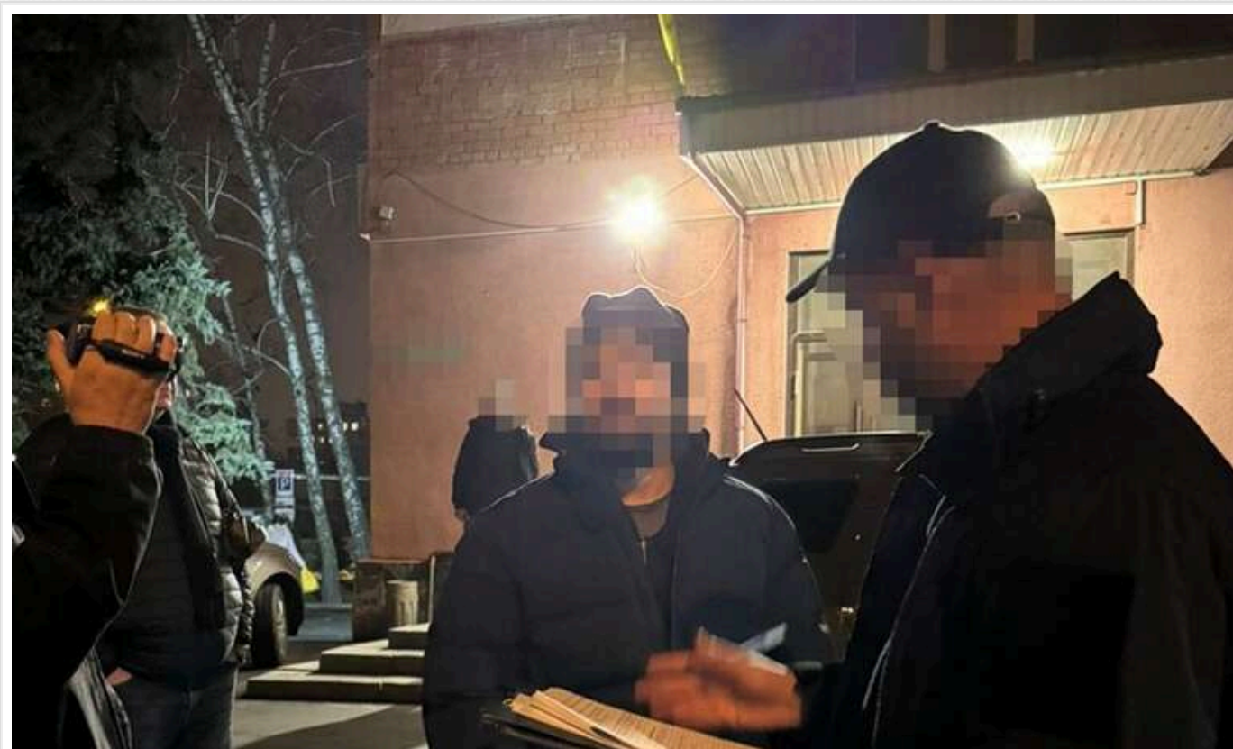
Дезертир із Харкова організував канал виїзду військовослужбовців за кордон

Мешканець Харкова, який у квітні 2024 року самовільно покинув місце служби та переїхав до Дніпра, організував незаконний канал виїзду військовослужбовців до Європи. За даними слідства, один виїзд коштував сім тисяч євро.