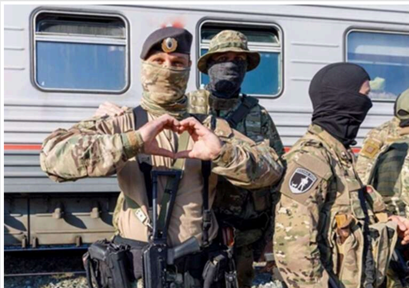
У Тюменській області окупант повернувся додому у відпустку та вбив дружину

У Тюменській області "ветеран" війни в Україні убив дружину під час відпустки. Йому здалося, що вона його зрадила.