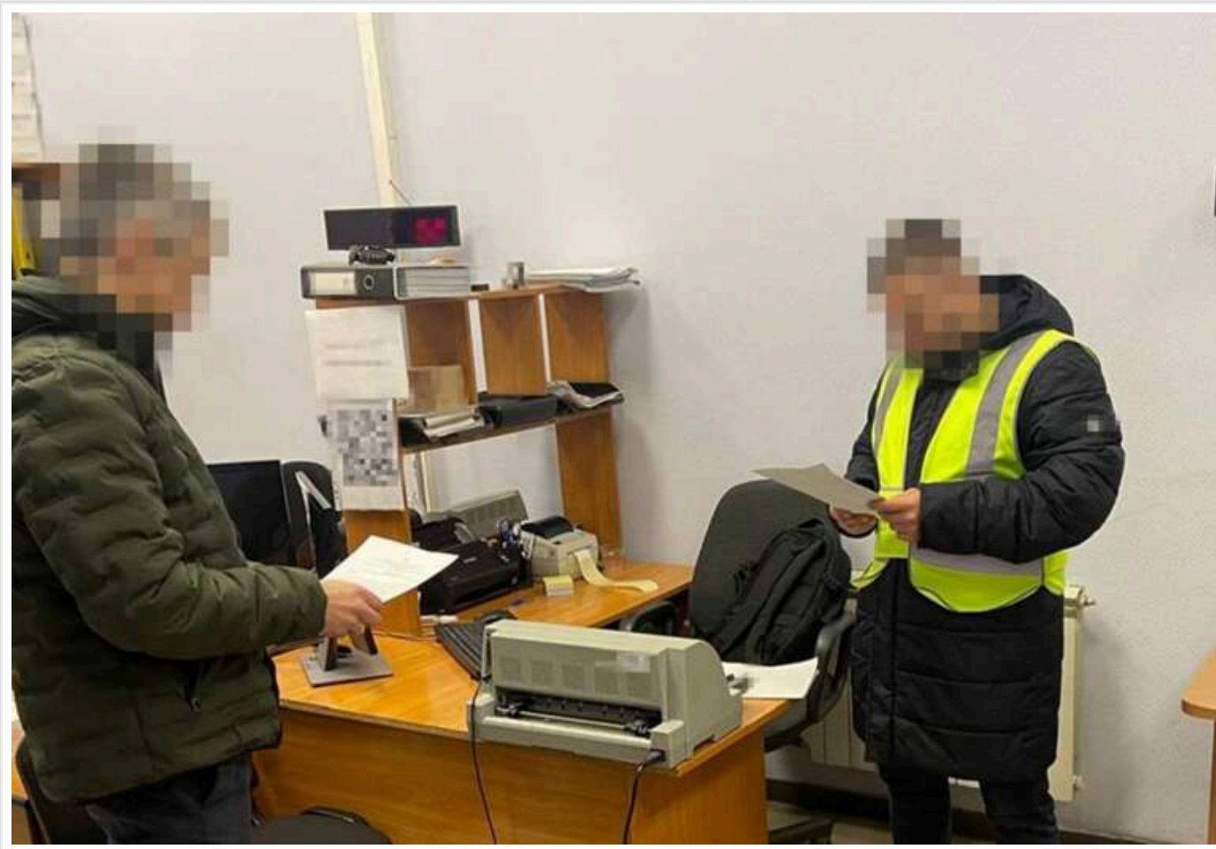
СБУ і Нацполіція викрили чиновника КМДА, який отримав від держави 170 тисяч гривень виплат за фальшиву інвалідність