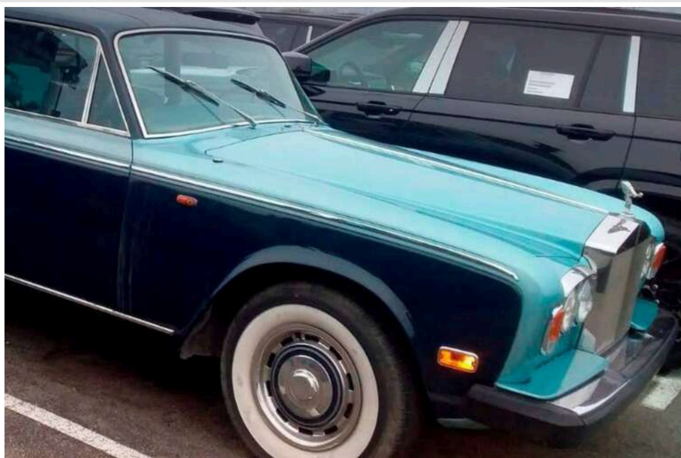
Контрабанда ретро-автомобілів: Детективи БЕБ арештували елітний Rolls-Royce

В рамках розслідування кримінальної справи щодо контрабанди елітних автомобілів, детективи Територіального управління Бюро економічної безпеки (БЕБ) в Київській області за ухвалою слідчого судді арештували незаконно ввезений автомобіль Rolls-Royce Silver Wraith II 1976 року випуску.