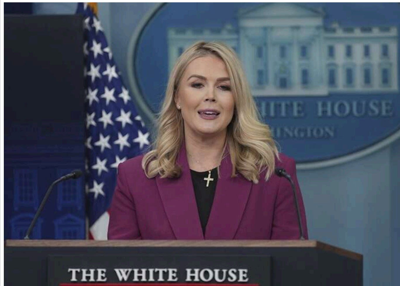
У Білому домі звинуватили Байдена у виділенні 50 мільйонів доларів на презервативи для Гази

У команді Дональда Трампа розкритикували адміністрацію Джо Байдена за нібито виділення 50 мільйонів доларів на програми, пов'язані з контрацепцією в секторі Газа.