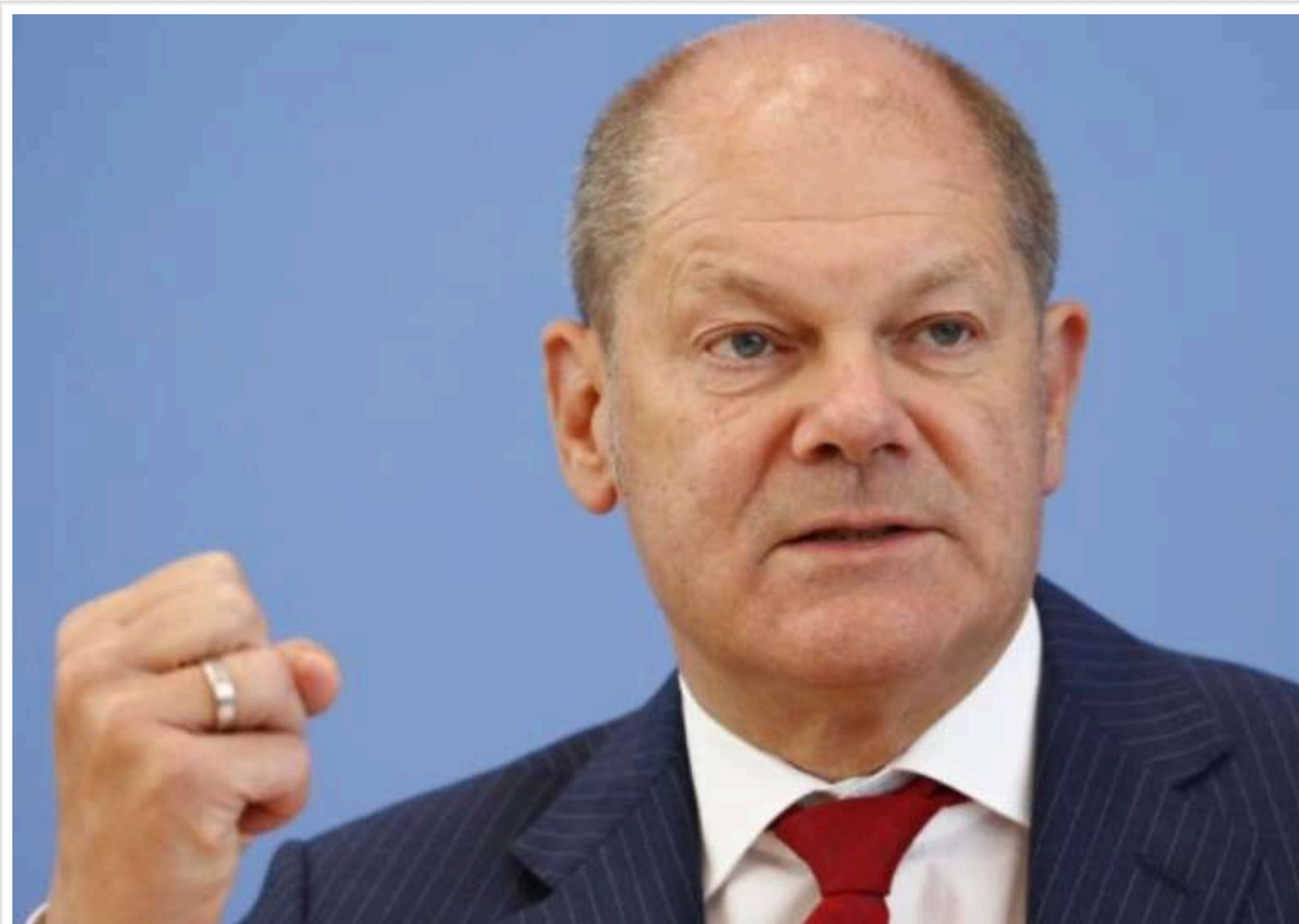
Шольц назвав огидною підтримку ультраправих в Європі Маском

Канцлер Німеччини Олаф Шольц різко висловився проти підтримки американським мільярдером Ілоном Маском правих партій Європи, назвавши це "дійсно огидним".