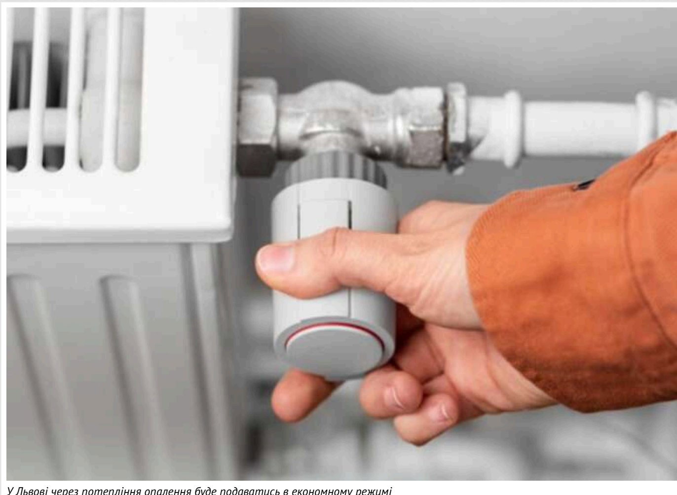
У Львові через потепління опалення буде подаватись в економному режимі

В окремих регіонах України протягом останніх кількох днів спостерігається доволі висока температура. Наприклад, у Львові вона досягає +10.