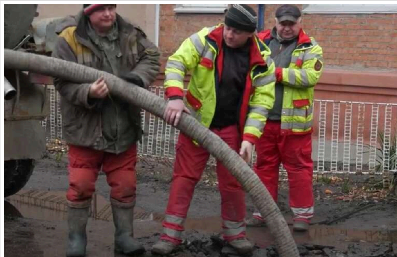
Житомиру загрожує комунальний колапс через мобілізацію, – «Житомирводоканал»

У Житомирі мобілізація може призвести до кризи в сфері комунальних послуг.