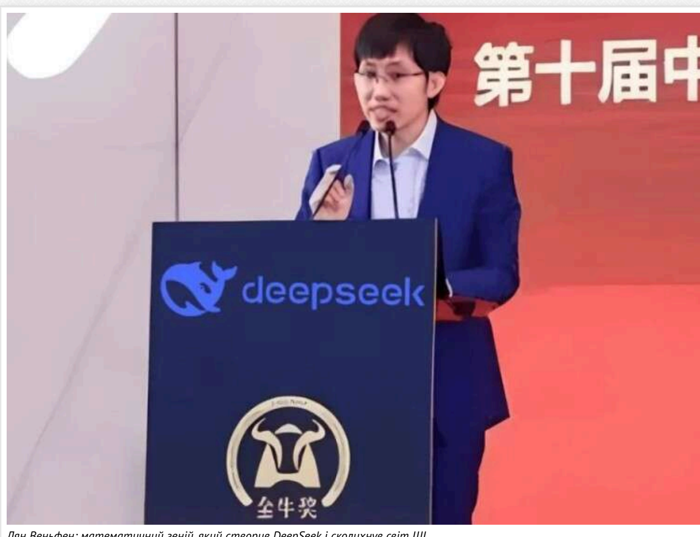
Лян Веньфен: математичний геній, який створив DeepSeek і сколихнув світ ШІ

Лян Веньфен — геній математики, який заснував декілька компаній, перш ніж створити ШІ, що вразив світ.