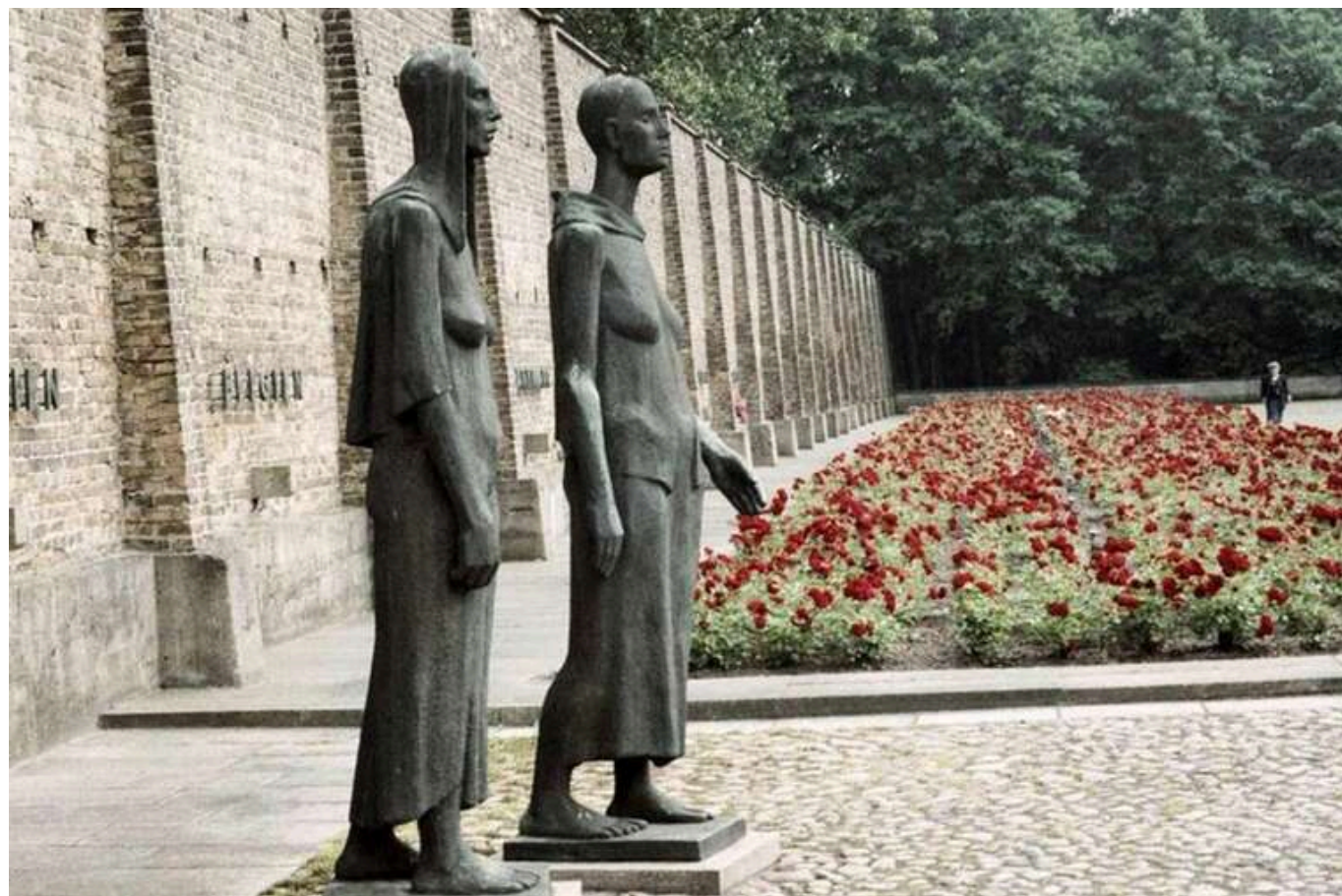
Німеччина продовжить фінансувати гуманітарні проекти в Санкт-Петербурзі, попри війну в Україні

Німеччина продовжить фінансувати гуманітарні проекти в Санкт-Петербурзі на суму 12 млн євро, попри тривалу війну в Україні.