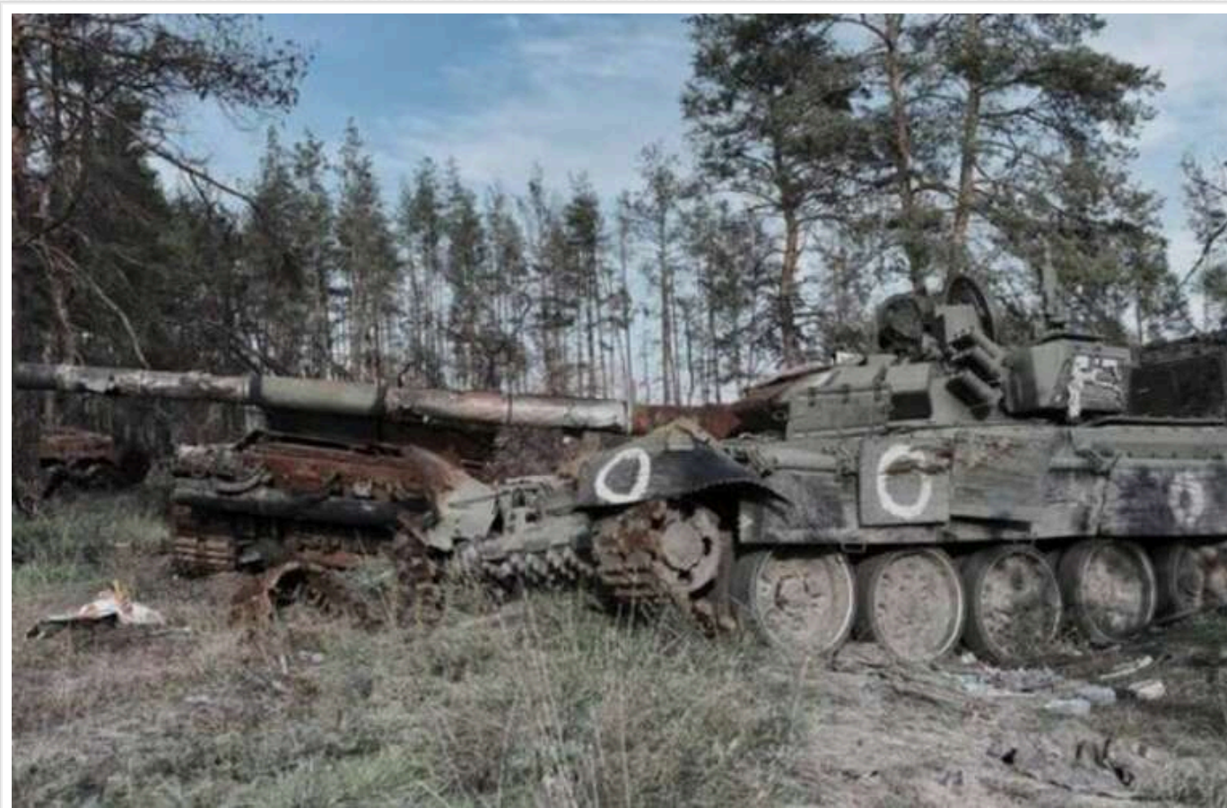
Втрати ворога: за добу ЗСУ ліквідували ще 1670 окупантів та майже 30 артсистем

За період з 28 на 29 січня російські війська втратили в боях із Силами оборони на фронті 1670 солдатів, систему реактивного залпового вогню і 10 танків.