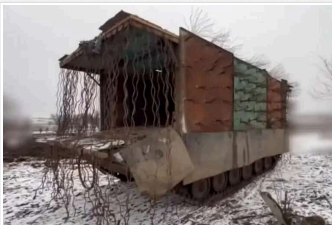
Російські пропагандисти похвалилися "жорсткою" БМП з кошлатим "мангалом"

Військова техніка, яка має додаткове бронювання, була помічена в одному з сюжетів російських ЗМІ. Пересувний "сарай" рухається в районі Часового Яру в Донецькій області.