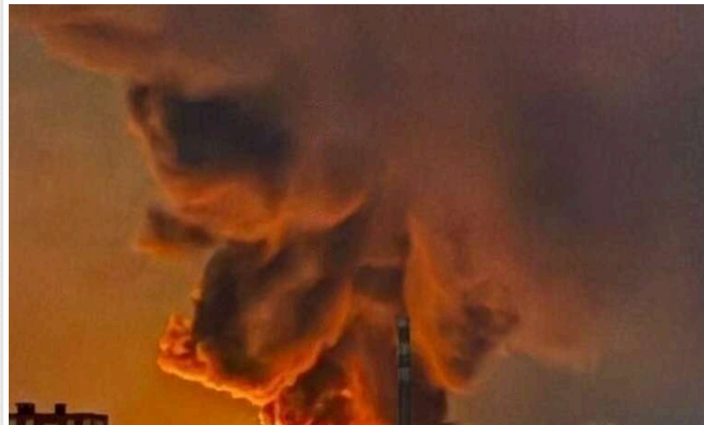
У Росії вночі дрони атакували "ядерний об'єкт"