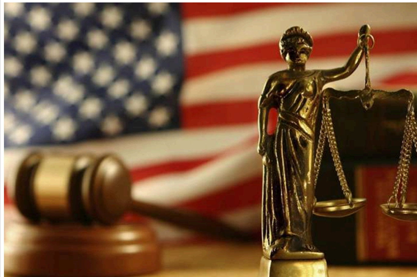
AP: У Штатах суд заблокував рішення Трампа щодо замороження зовнішньої допомоги

Федеральний суддя США тимчасово зупинив рішення адміністрації президента Дональда Трампа щодо заморожування фінансування програм з надання міжнародної допомоги та видачі грантів.