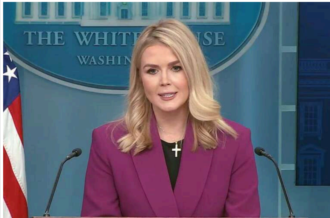
Команда Байдена витрчала бюджет "як п'яні матроси", - прессекретарка Білого дому Левітт

США призупинили фінансування програм допомоги для їх перегляду, команда Байдена витрчала бюджет "як п'яні матроси".