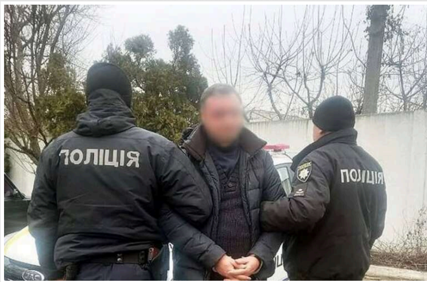
Киянин поранив пенсіонера під час спроби пограбування на Чернігівщині

Увечері 24 січня на подвір'я 65-річного жителя Ічнянської громади увірвався 52-річний чоловік. Нападник вистрілив потерпілому в ногу та втік з місця злочину. Потерпілого доставили до лікарні.