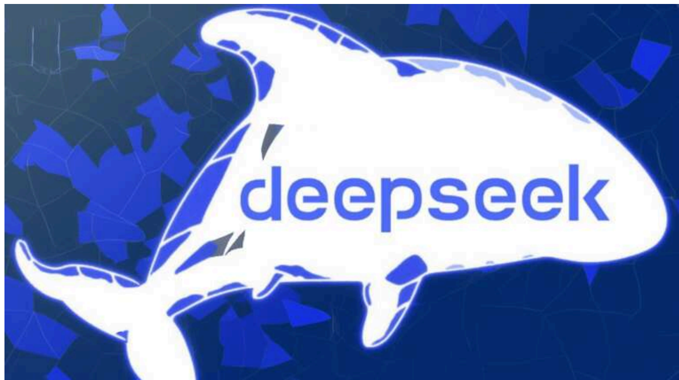
Чат-бот китайського стартапу DeepSeek призупинив реєстрацію користувачів після атак

Чат-бот китайського стартапу DeepSeek, який швидко став популярним і потрапив у топ застосунків у багатьох країнах, включно з Росією, призупинив реєстрацію нових користувачів через «масштабні шкідливі атаки». Експерти діляться безліччю деталей про продукт, який викликав бурхливі обговорення на світових ринках.