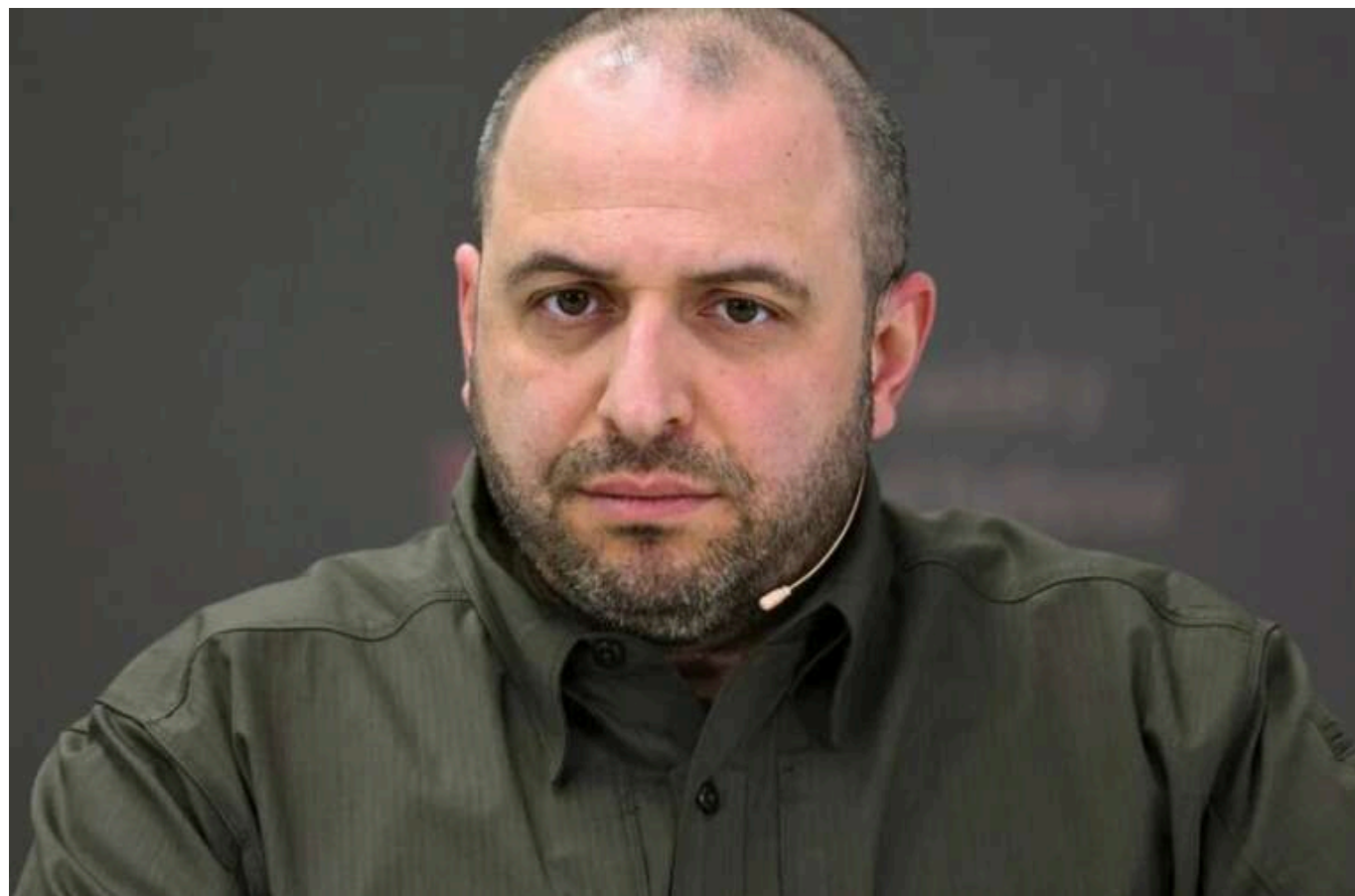
НАБУ розслідує можливе зловживання владою міністром оборони Рустемом Умеровим

Національне антикорупційне бюро України підтвердило, що зареєструвало кримінальне провадження щодо міністра оборони Рустема Умерова за частиною 2 статті 364 Кримінального кодексу України (зловживання владою або службовим становищем).