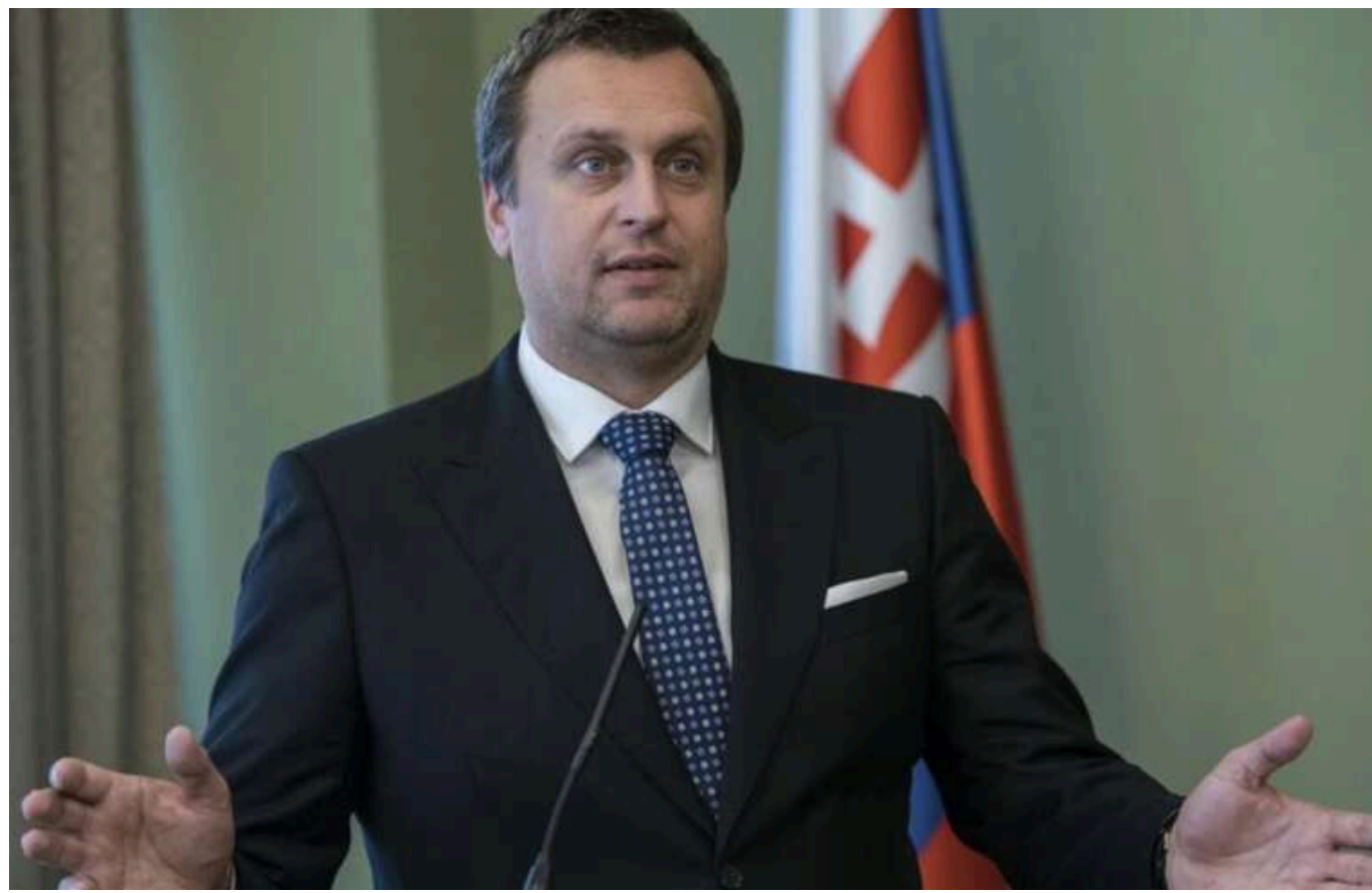
Віцеспікер Словаччини обурився, що до Аушвіцу запросили "прихильника Бандери" Зеленського, а не Російську Федерацію

Заступник голови парламенту Словаччини Андрей Данко, який нещодавно відвідував Москву з візитом, висловив жаль, що Росію не запросили на святкування 80-ї річниці визволення нацистського табору Аушвіц-Біркенау.