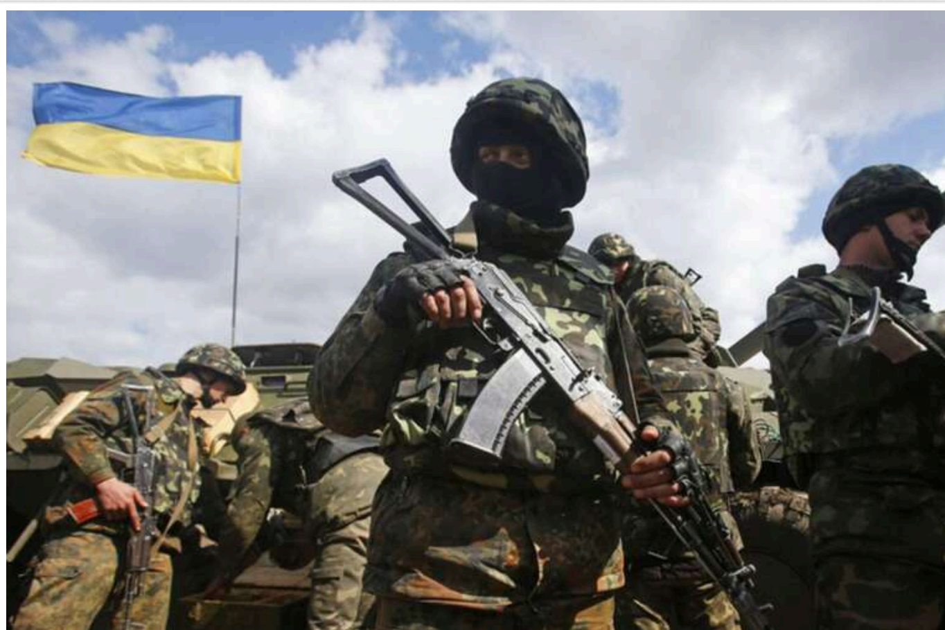
Україна може погодитися на тимчасові компроміси для припинення війни, - ексчиновник Держдепу США