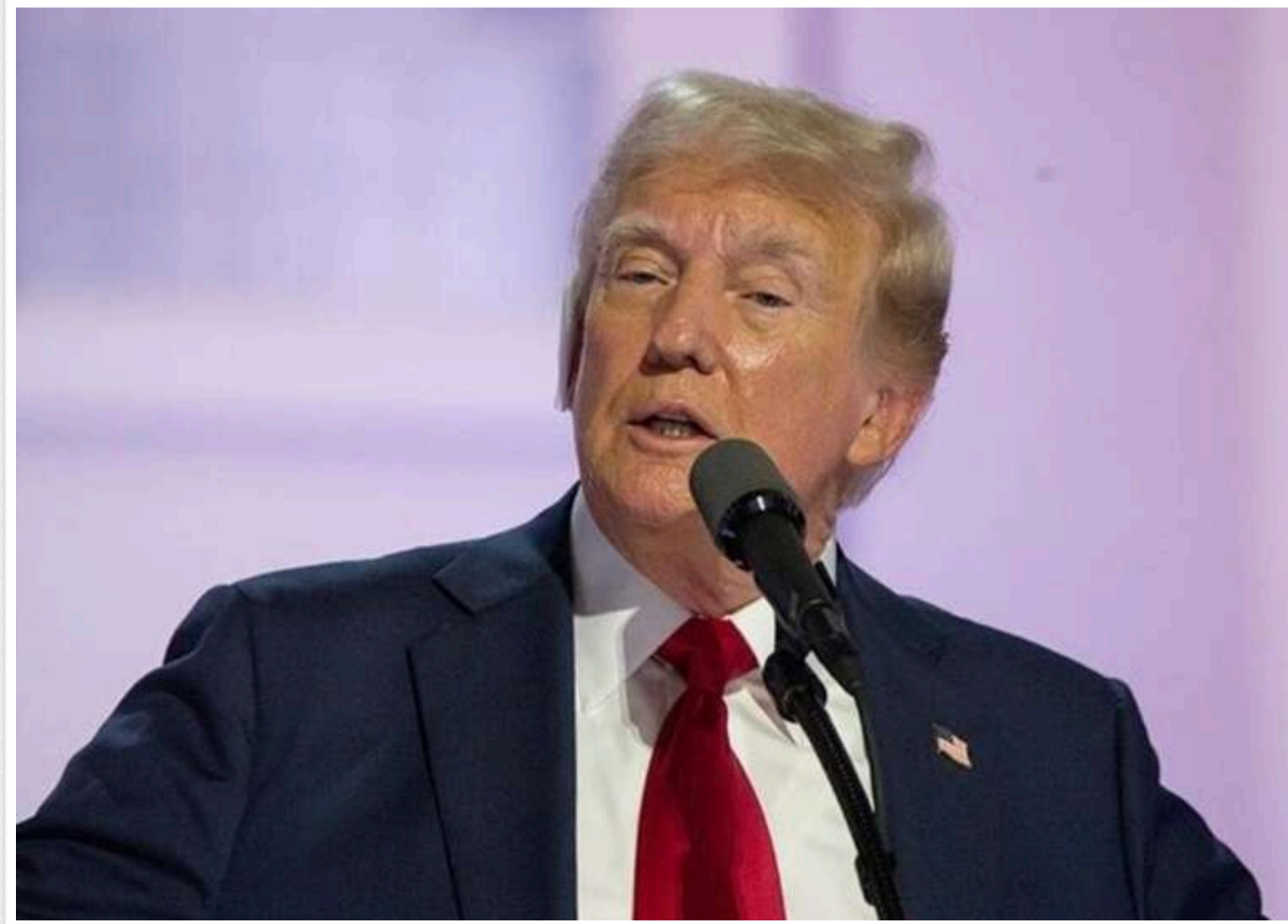
Трамп призупиняє федеральні гранти та позики в США

Білий дім з 30 січня призупиняє федеральні гранти та позики в США, що викликає занепокоєння серед організацій, які отримують фінансування, повідомляє Associated Press.