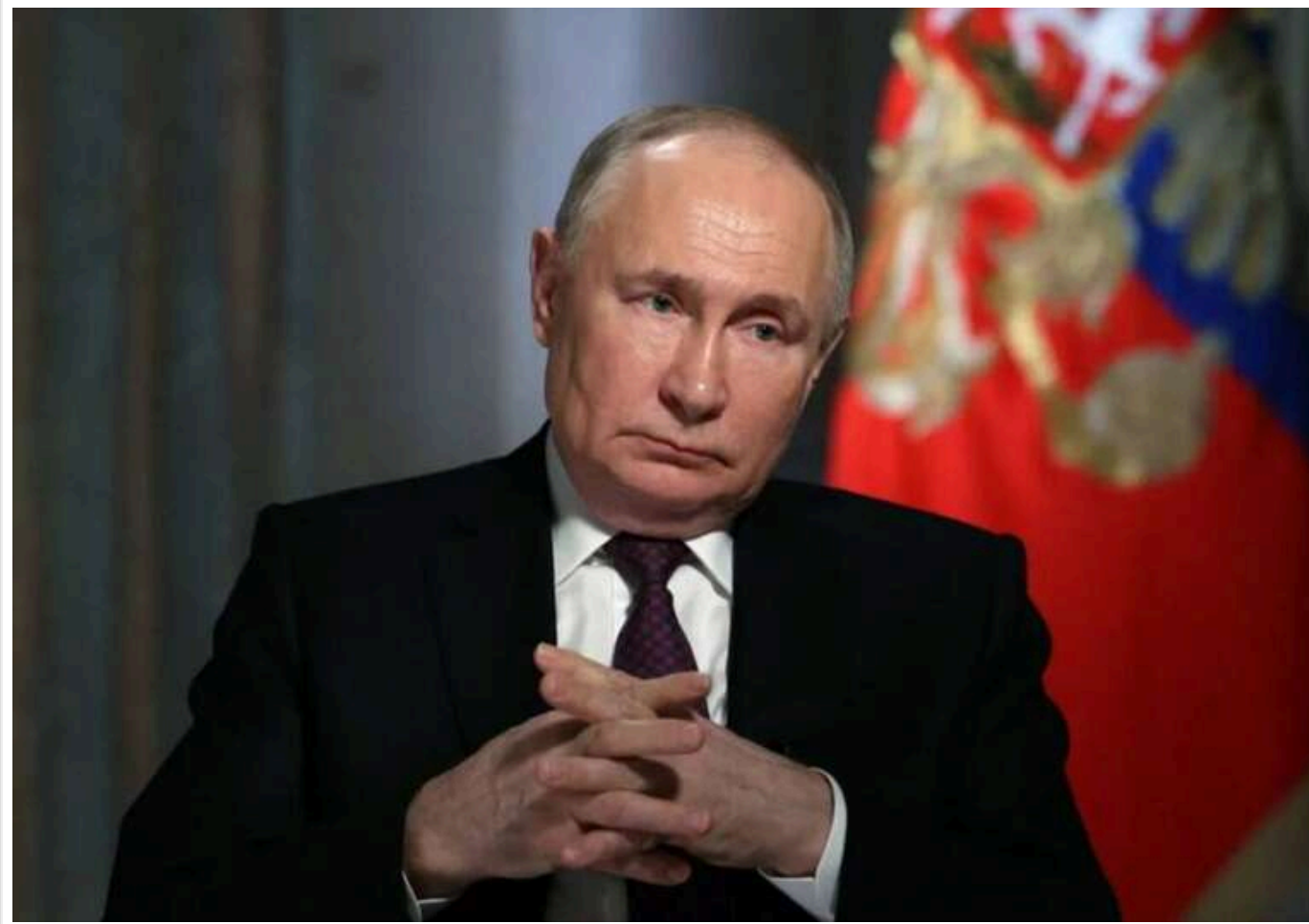
Україні потрібно було просто піти з Донецької та Луганської областей після 24 лютого, – Путін

Президент Росії Володимир Путін неодноразово висловлював думку, що Україні слід було залишити Донецьку та Луганську області після 24 лютого 2022 року, коли Росія розпочала повномасштабне вторгнення в Україну.