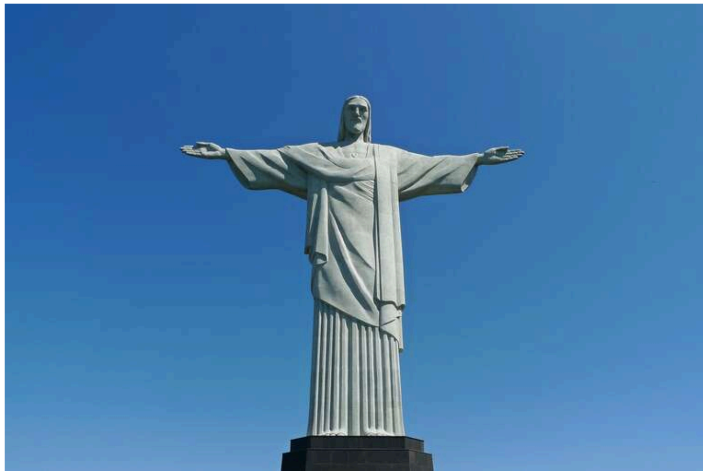
Через депортаційну політику Трампа країни Латинської Америки проведуть терміновий саміт

Лідери країн Латинської Америки зберуться 30 січня на екстрений саміт. Його викликана політика масових депортацій мігрантів президентом США Дональдом Трампом.