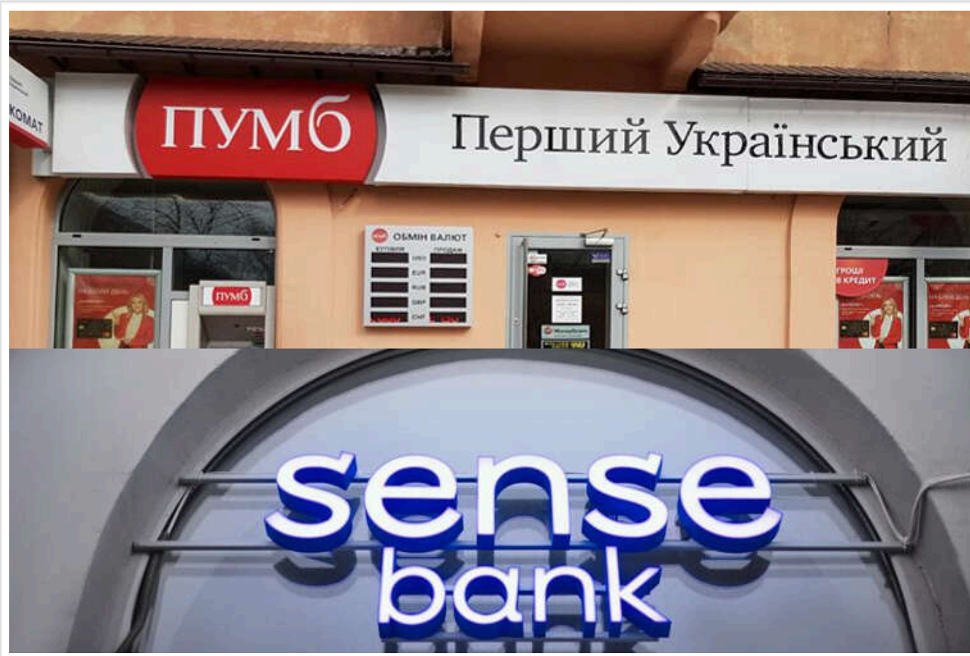
ПУМБ і "Сенс банк" приєдналися до меморандуму щодо обмеження банківських переказів

ПУМБ і "Сенс банк" стали новими підписантами Меморандуму «Про забезпечення прозорості функціонування ринку платіжних послуг».