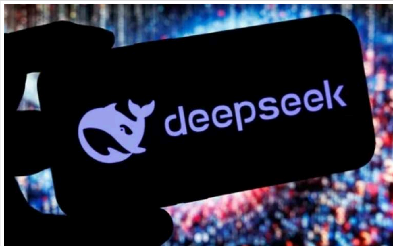
Статки 500 найбагатших людей світу зменшилися на 108 мільярдів доларів через успіх китайського чат-бота DeepSeek

Статки 500 найбагатших людей світу скоротилися на $108 мільярдів на тлі падіння акцій технологічного сектора після успіху китайського чат-бота DeepSeek-R1.