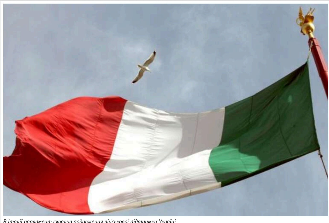
В Італії парламент схвалив подовження військової підтримки Україні

Італійський парламент проголосував за продовження постачання військової допомоги Україні до 2025 року.